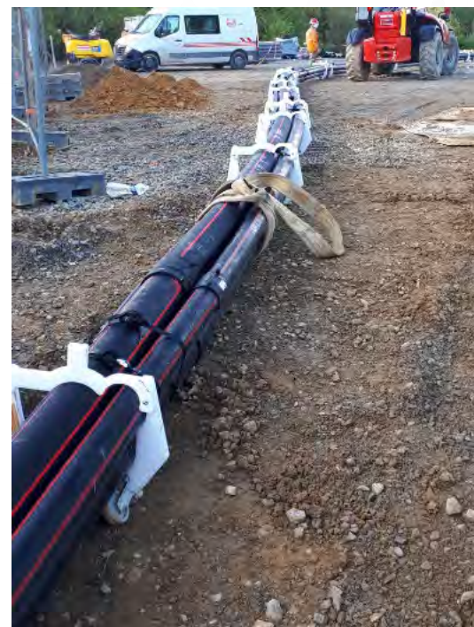
Peignes à roulettes pour être positionnés dans galerie