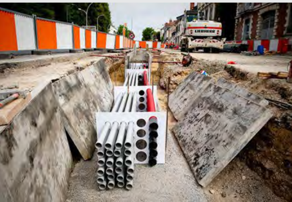
Peignes pour réseau de tramway

Ils sont réalisés à votre demande suivant les spécificités de votre chantier. Ils pourront être réalisés soit par usinage soit par injection, en fonction de vos quantités, dans des matériaux plastiques pour certains recyclables.